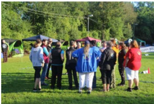
Briefing der Richterin vor dem Lauf